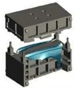
【試作型 ～小回りのきく成形工法～】

「フィリピンのデータデザインセンター含めシステムを統一できたことで、連携が強化されました。CAD工程の作業スピードも相当あがっています。」